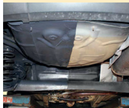
Links mit und rechts ohne Unterbodenschutz

Schützen Sie Achse und Karosserie vor Salz und Korrosion. Lassen Sie vor dem Winter Unterbodenschutz auftragen. Durch seine Wasserbasis ist der Unterbodenschutz umweltfreundlich. Weitere Vorteile sind die Aufwertung des Fahrzeugs sowie die Einsparung von Reparaturkosten.